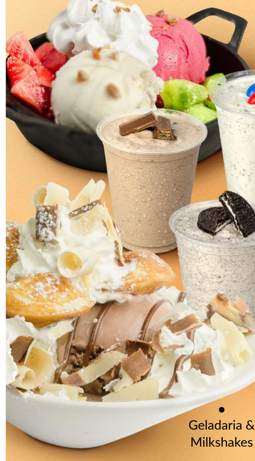
Geladaria & Milkshakes