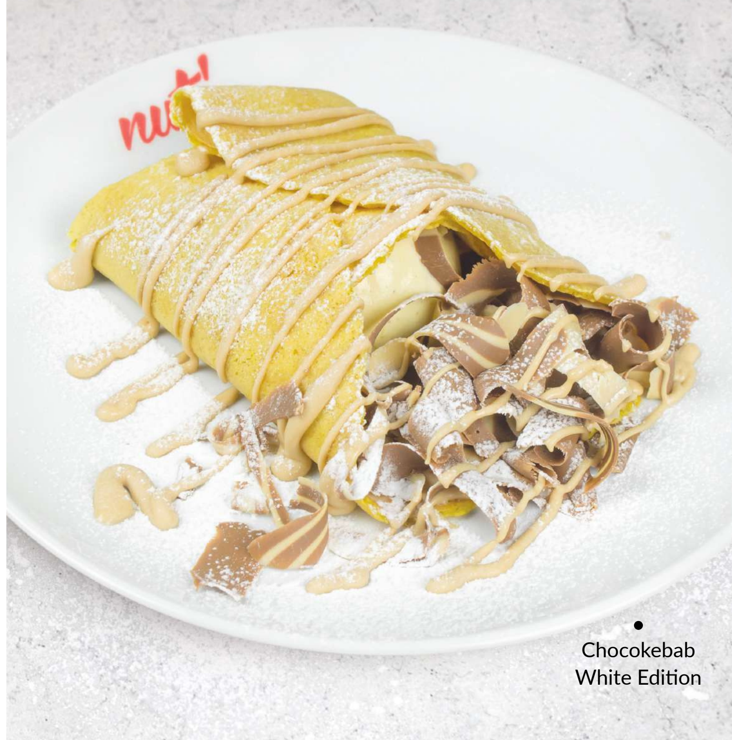
● Chocokebab White Edition