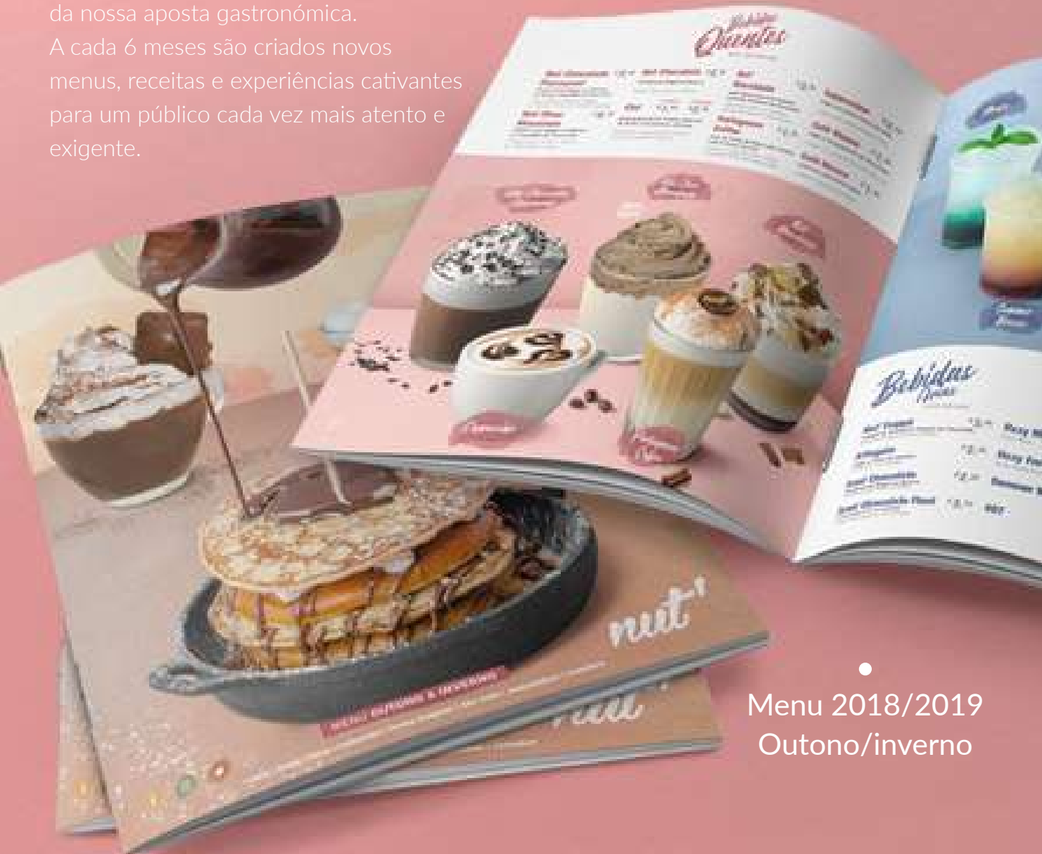
Menu 2018/2019 Outono/inverno

A cada 6 meses são criados novos menus, receitas e experiências cativantes para um público cada vez mais atento e exigente.